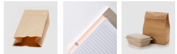
Bäckertüte (auch mit Sichtfenster) Schreibblöcke und Hefte Verpackungen aus Papier