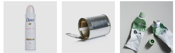
Leere Spraydose Konservendosen Tuben