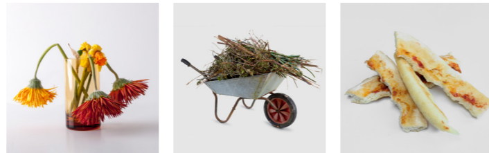
Pflanzliche Abfälle Gartenabfälle Lebensmittelreste

Hinweis: Nur unverpackte Lebensmittel! Verpackungen getrennt entsorgen!