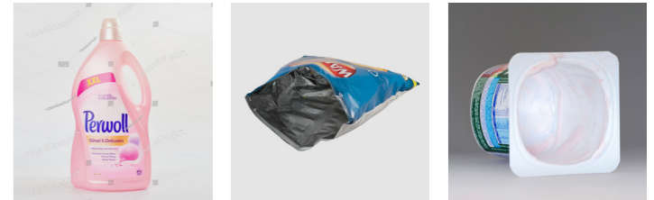
Waschmittelbehälter Verbundverpackungen Joghurtbecher (Deckel abziehen!)