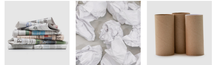
Zeitungen Zettel Kartonrollen