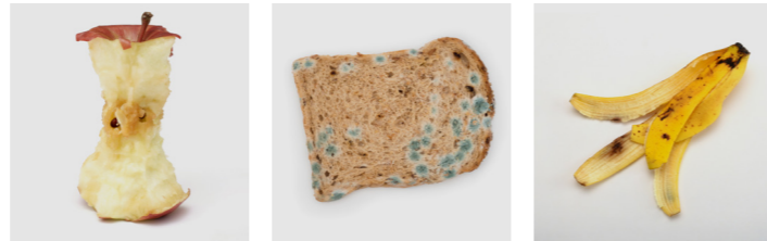
Apfelbutzen Verdorbene Lebensmittel Obst- und Gemüseschalen