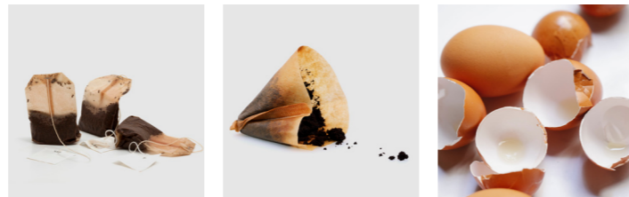
Teebeutel Kaffeesatz Eierschalen