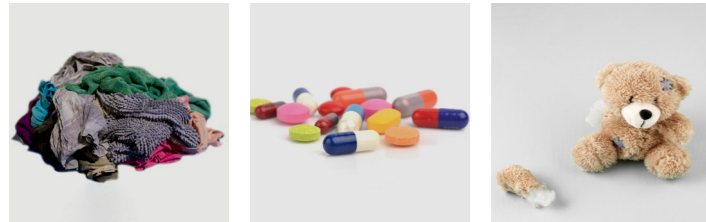
Kaputte Kleidung Medikamente Defektes Spielzeug