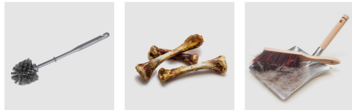
Klobürste Knochen Kehrreste

Hinweis: Keinesfalls Elektrogeräte und Batterien!