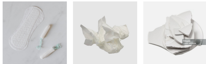
Binden, Tampons Taschentücher Zerbrochenes Glas und Porzellan