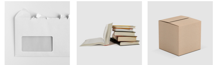
Briefumschläge Bücher Kartonagen